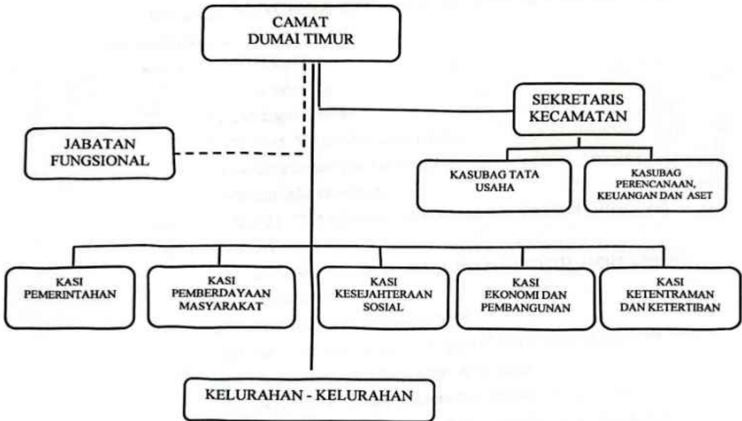
GAMBAR 1.1. STRUKTUR ORGANISASI KECAMATAN DUMAI TIMUR